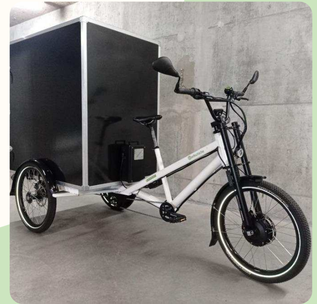
die Radkutsche, Namensfindung ausstehend, fast unermüdlicher Transporthelfer